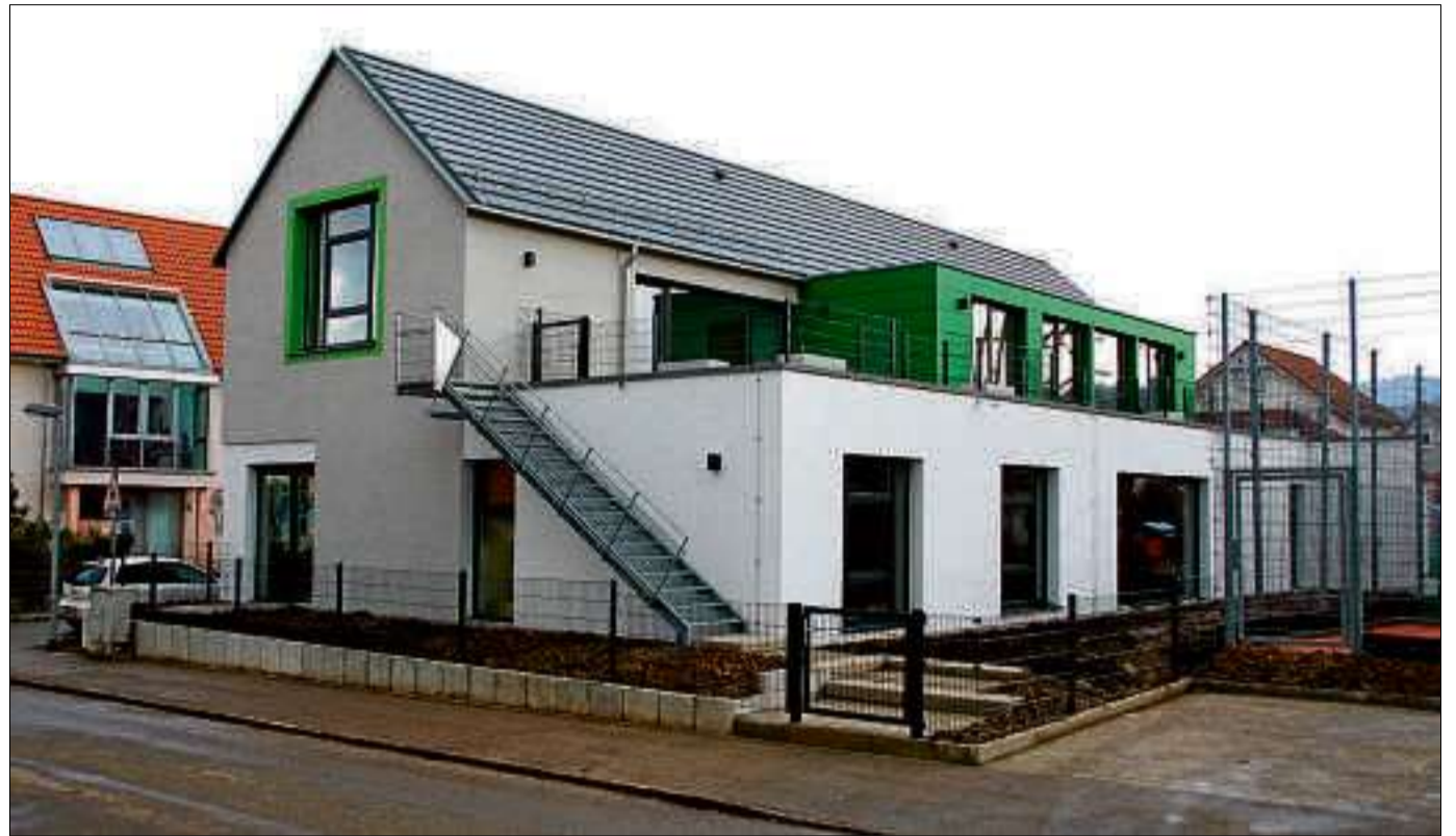
Der moderne, zweigeschossige Anbau fügt sich harmonisch in die Auchterstraße ein und bildet mit dem bestehenden Gebäude eine Einheit. Bilder: Architekturbüro Orth

Am Nikolaustag, 6. Dezember, wird das Kinderhaus offiziell übergeben. Alle Interessierten sind herzlich eingeladen, sich von 14.30 bis 16.30 Uhr umzuschauen.