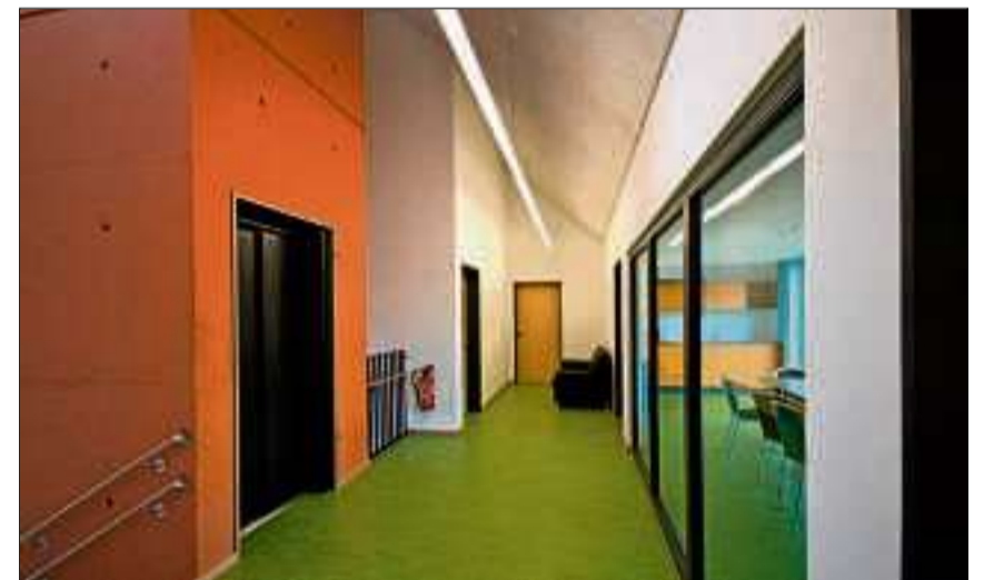
Eine klare Architektursprache und freundliche Farben mit viel Grün und Orange unterstreichen die Nutzung als Kinderhaus.