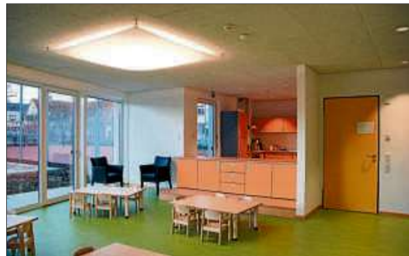
Licht, hell und sehr geräumig. Jede der vier Gruppen hat einen eigenen Gruppenraum .